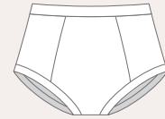
Caleçons pour Enfants